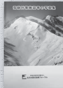
雪崩対策施設等の写真集