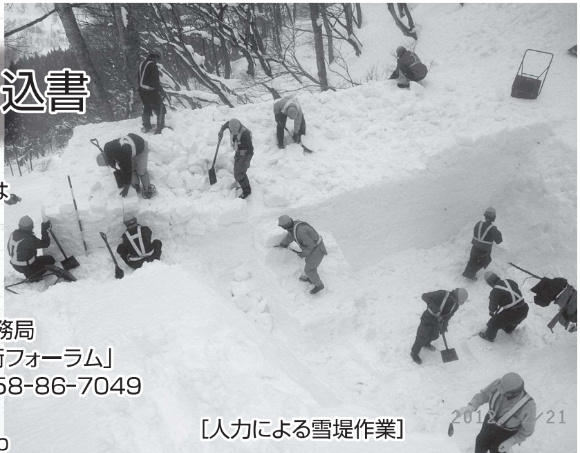
[人力による雪堤作業]